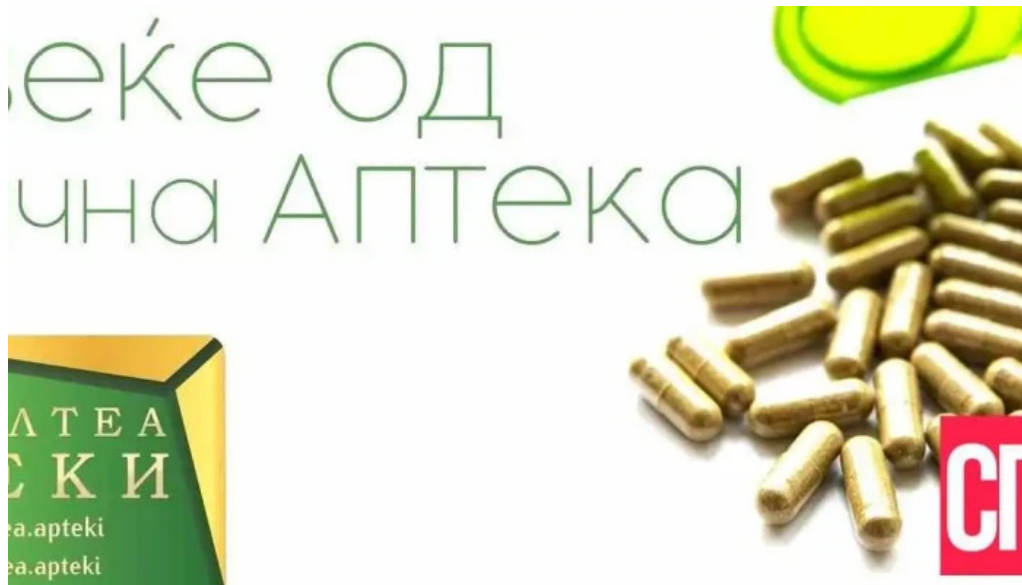
Apteka altea strumica sie