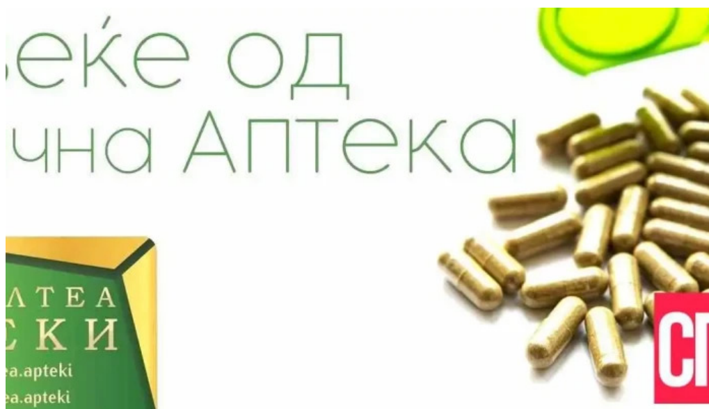
Apteka altea strumica ????????