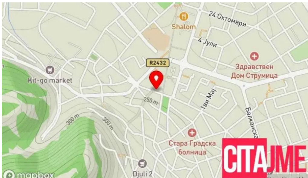
Apteka altea strumica ????