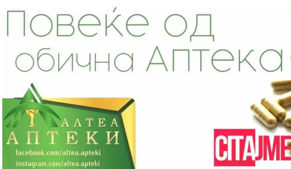
Apteka altea strumica od sopstvenikot