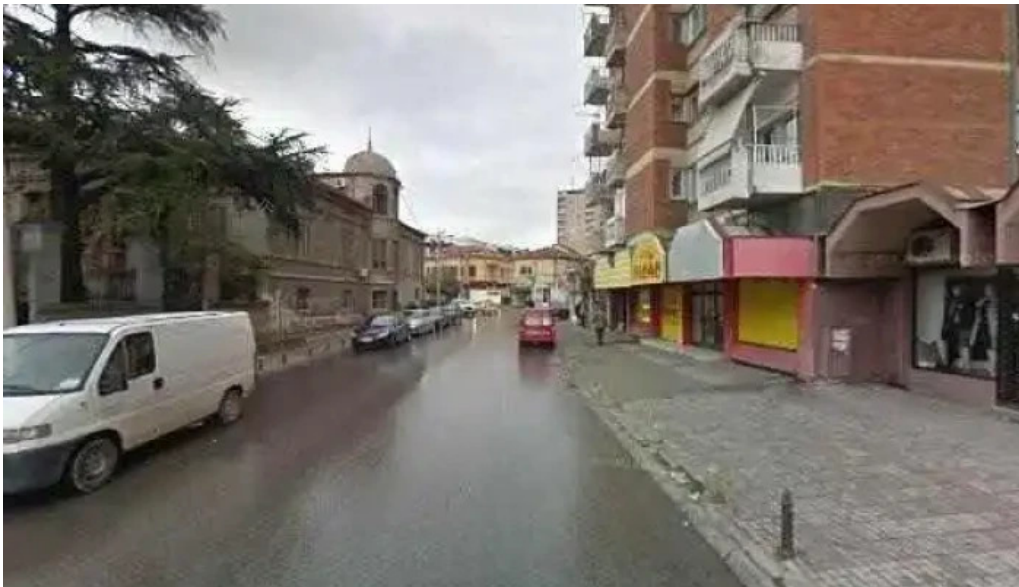
Zegin ulichen prikaz i 360deg