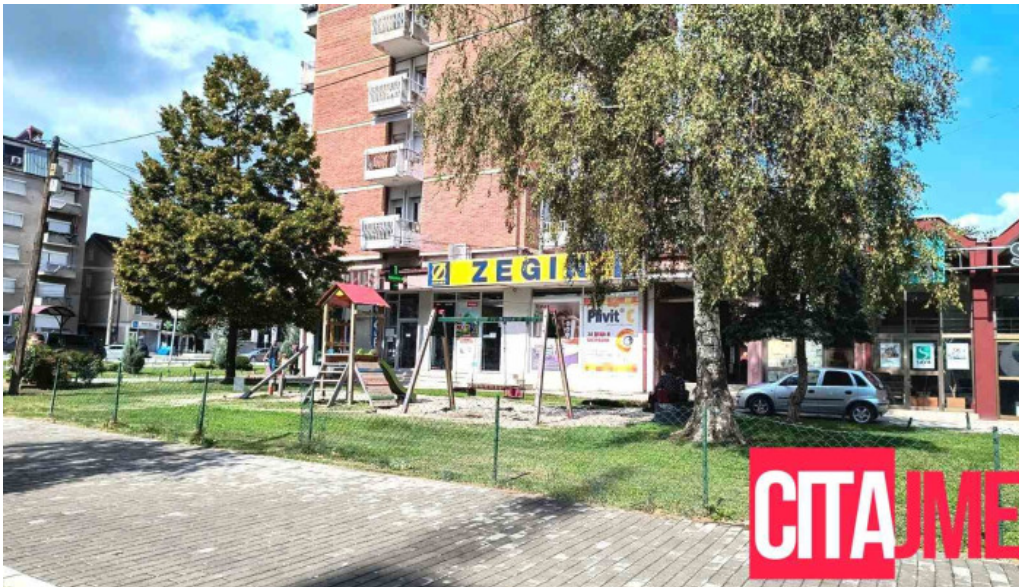
Zegin od sopstvenikot